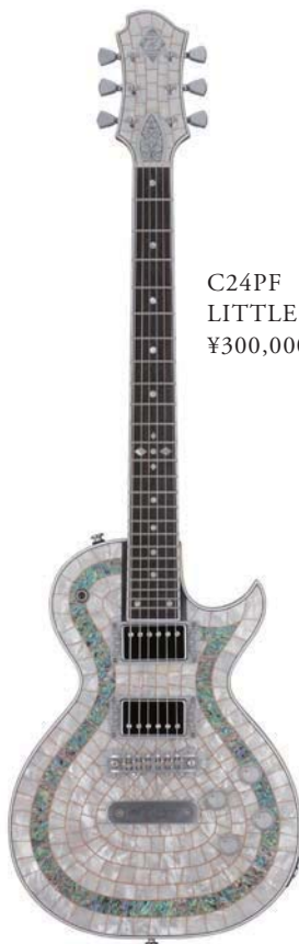
C24PF LITTLE RING PEARL HEAD ¥300,000