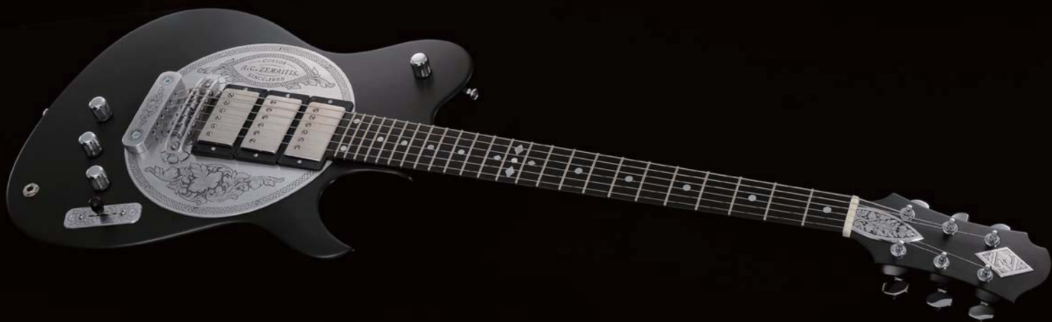
S24DT ARCHTOP & ARABESQUE

世界が誇るロックレジェンド「ローリングストーンズ」のギタリスト“ロン・ウッド”。彼の洗練されたアイデアにより誕生したこのディスクフロント・シリーズは、世界で最も有名なゼマイティスギターと言っても過言ではない。ディスクを型取ったメタルプレートに配したその特徴的かつ斬新なデザインは、一度目にした者の頭から離れることはない。