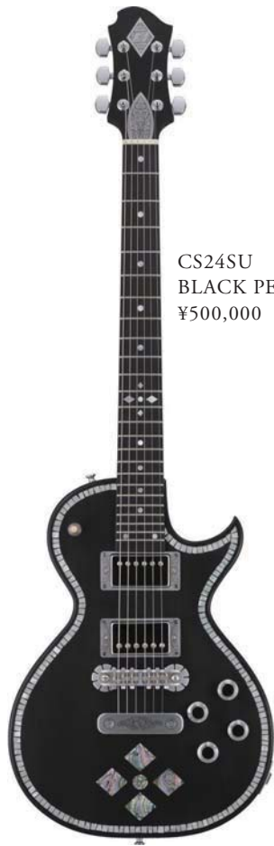
CS24SU BLACK PEARL DIAMOND ¥500,000