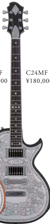
C24MF BK ¥180,000