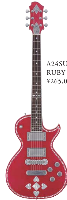
A24SU RUBY HEART ¥265,000