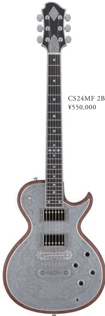
CS24MF 2B ¥550,000