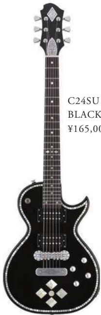
C24SU BLACK PEARL DIAMOND ¥165,000