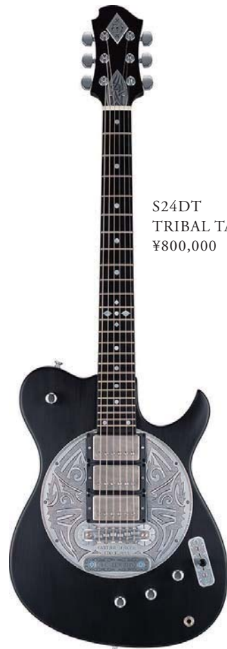
S24DT TRIBAL TATTOO DESIGN ¥800,000