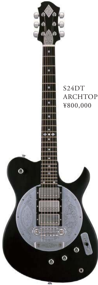
S24DT ARCHTOP & ARABESQUE ¥800,000