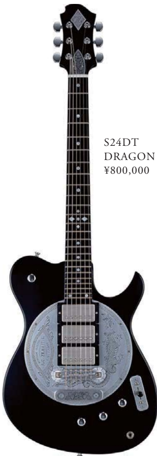
S24DT DRAGON ¥800,000