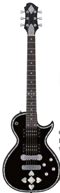
C24SU BLACK PEARL HEART ¥165,000