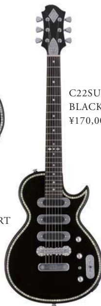
C22SU 3S BLACK PEARL ¥170,000