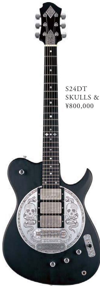
S24DT SKULLS & SNAKES ¥800,000