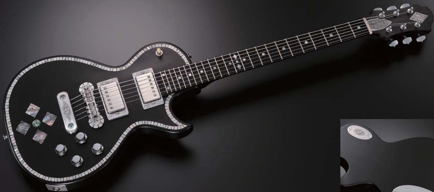
CS24SU BLACK PEARL DIAMOND

トニー・ゼマイティスは、アーチド・フレームトップやブラック・フィニッシュのギターなどシンプルなモデルも製作した。シンプルなギターに、パール・インレイを施したモデルやアクセント的にメタルをマウントしたギターなど、顧客のリクエストに応える形で、様々な個性的なギターを生み出した。スーペリア・シリーズは、ゼマイティス・ギターの基本設計に加えて、特別な装飾を施すことで、メタル・フロントやパール・フロントとはまた違った独創的な魅力を放つ。