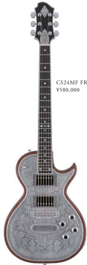
CS24MF FR 4C ¥580,000