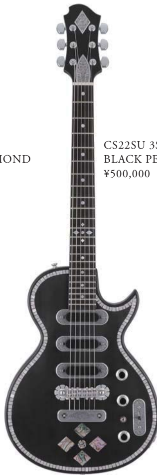
CS22SU 3S BLACK PEARL DIAMOND ¥500,000