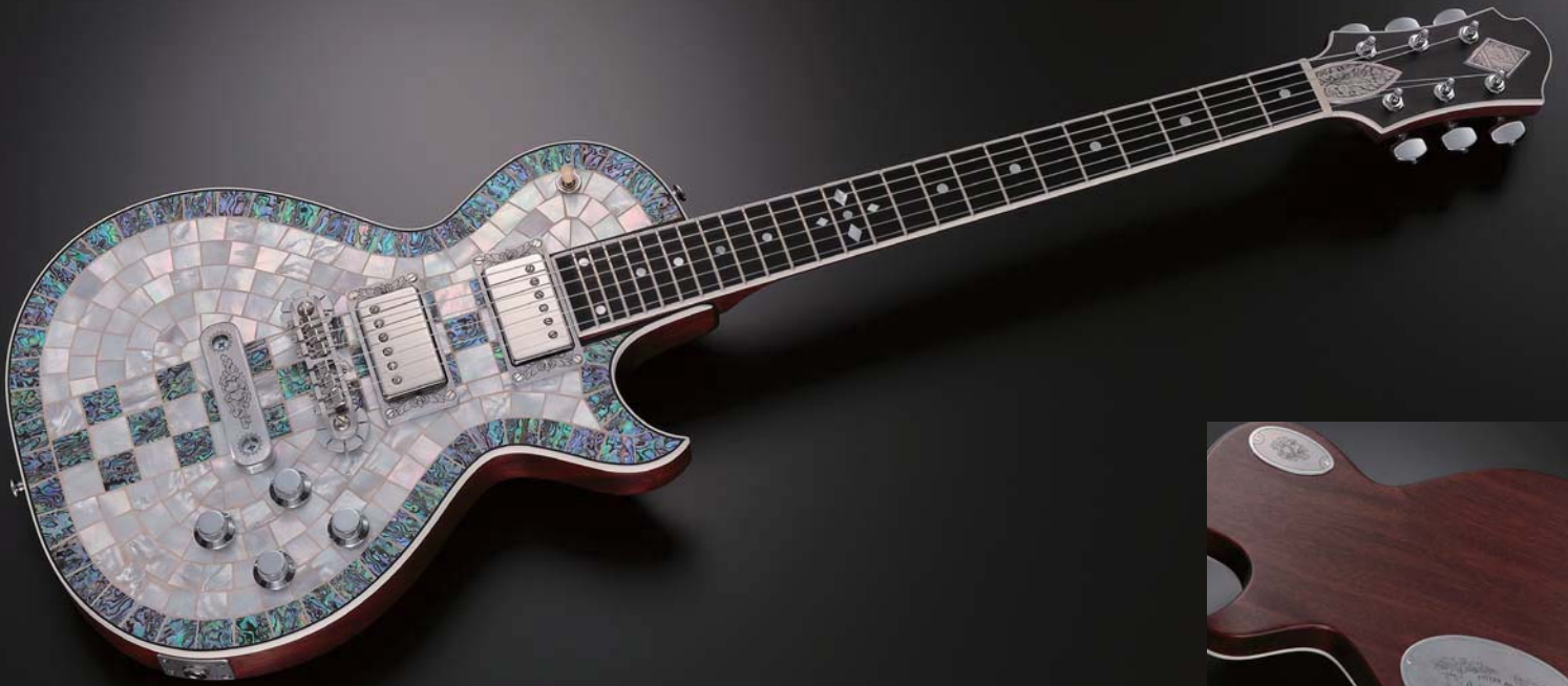
CS24PF RING CHESS

トニー・ゼマイティスの独創性が最も現れたパールフロント・シリーズ。ボデイトップ前面は敷き詰められたパールにより、妖艶かつ圧倒的な存在感を誇る。眩いばかりの輝きを放つそのギターは、光の強弱や角度により様々に表情を変え、多くの人々を魅了する。「世界で最も美しいギター」その称賛の声は後を絶たない。