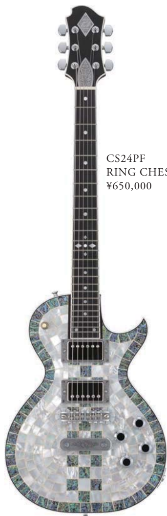
CS24PF RING CHESS ¥650,000