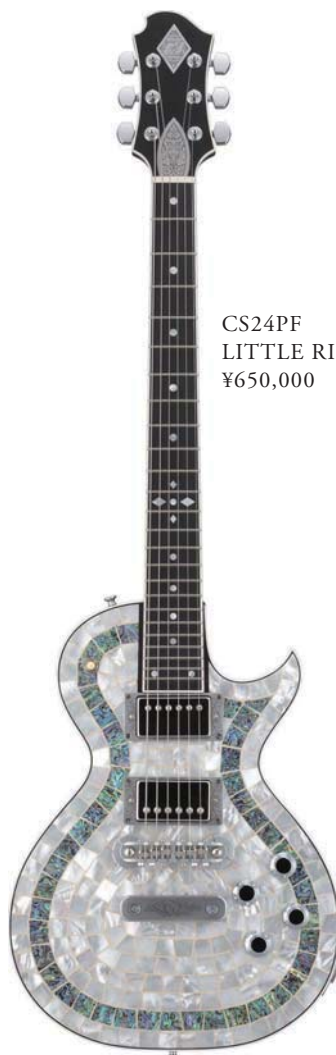
CS24PF LITTLE RING ¥650,000