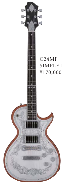
C24MF SIMPLE LEAF ¥170,000