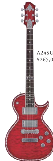
A24SU FLARE ¥265,000