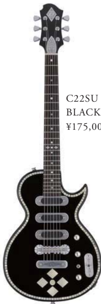
C22SU 3S BLACK PEARL DIAMOND ¥175,000