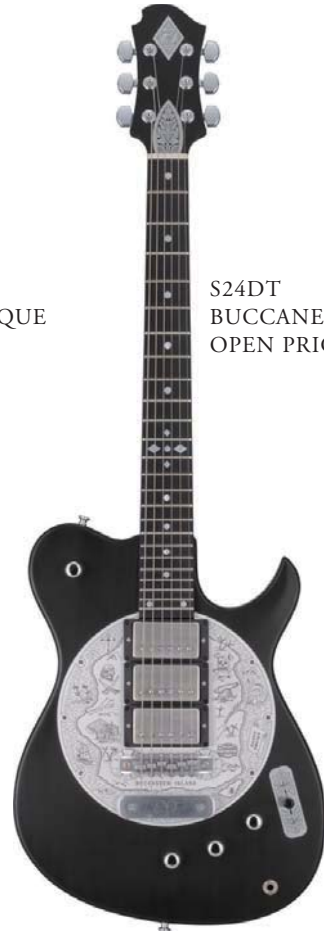
S24DT BUCCANEER ISLAND OPEN PRICE