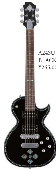
A24SU BLACK PEARL DIAMOND ¥265,000